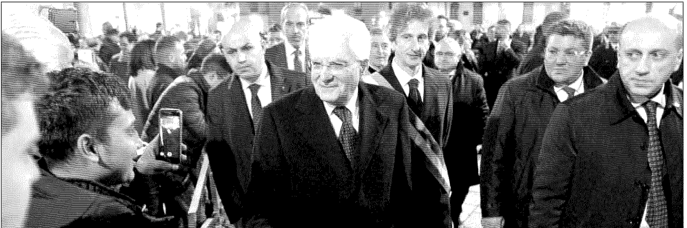
Il presidente Mattarella in piazza Sant'Oronzo

Mattarella: ripartire dalle eccellenze e dalla cultura. Serata magica all'Apollo